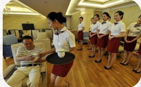
高铁站候车室VIP服务