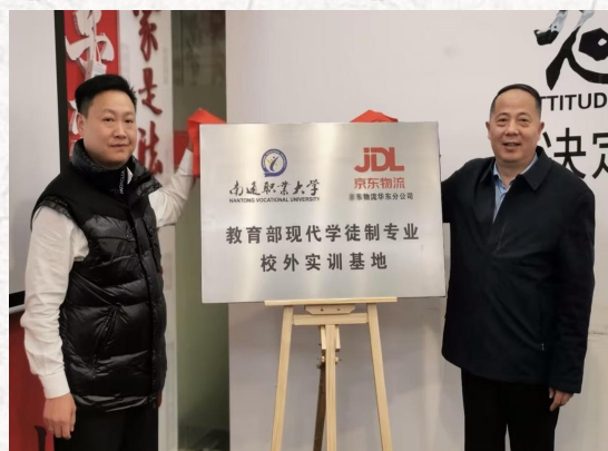
教育部首批现代学徒制试点验收专业-- 现代物流管理