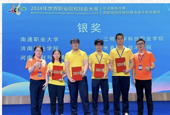
2024世界职业院校技能大赛总决赛争夺赛-- 电子商务赛项 银奖