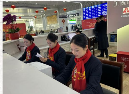
南通西站春运志愿服务