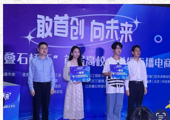
南通市直播电商大赛一等奖第一名 奖金 10000 元