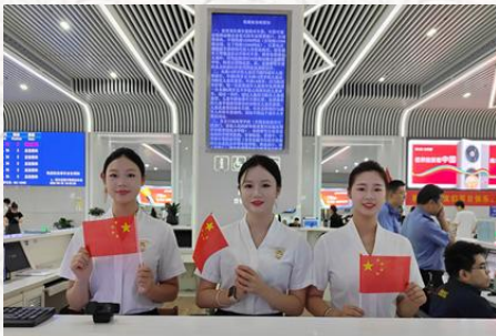
南通西站国庆客运志愿服务