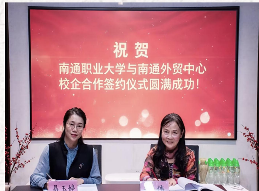
产教融合 校地合作