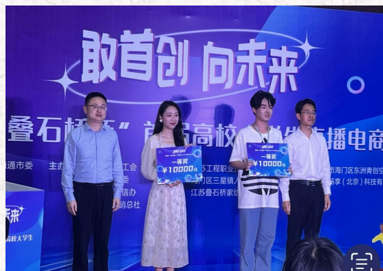
南通市直播电商大赛一等奖第一名 奖金 10000 元