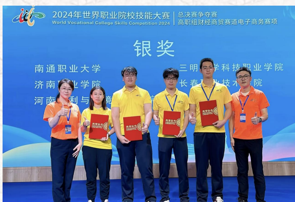
2024世界职业院校技能大赛总决赛争夺赛-- 电子商务赛项 银奖