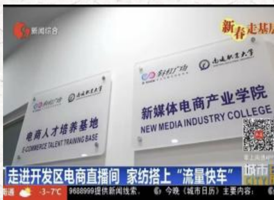
产业学院赋能地方支柱产业