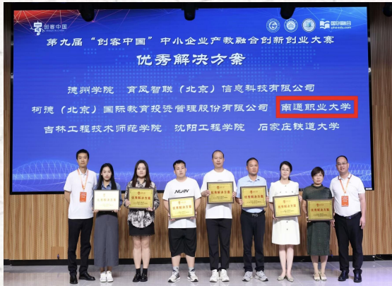
2024“创客中国”中小企业产教融合创新创业大赛 优秀解决方案