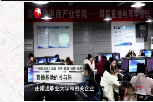
东方卫视报道电商学徒班