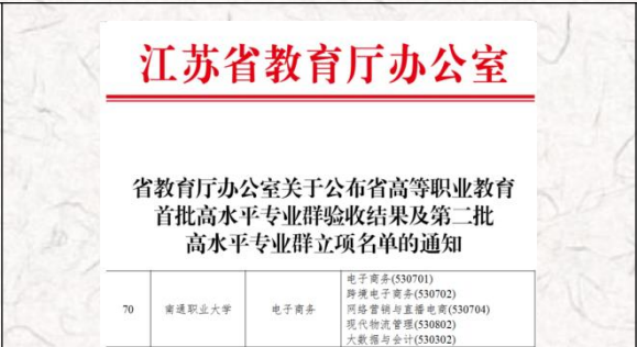
江苏省高水平专业群立项