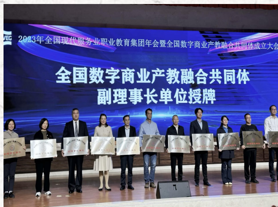
全国数字商业产教融合共同体 副理事长单位