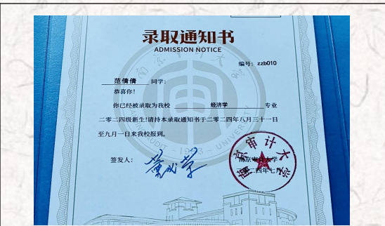
24届毕业生范倩倩 441 高分考取南京审计大学