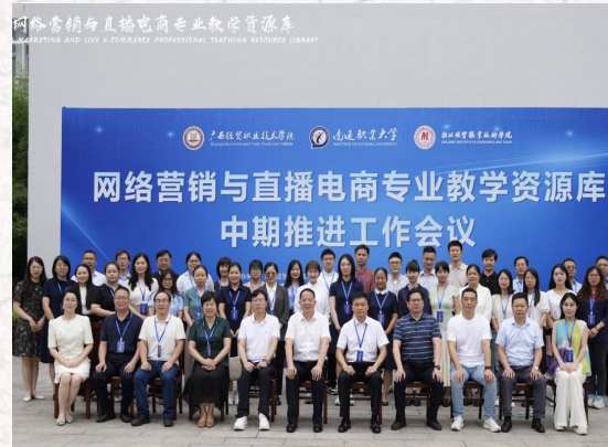
省级“网络营销与直播电商”专业教学资源库 联合主持单位