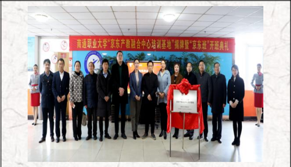
京东产教融合中心培训基地