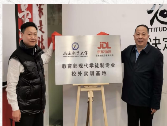
教育部首批现代学徒制试点验收专业-- 现代物流管理