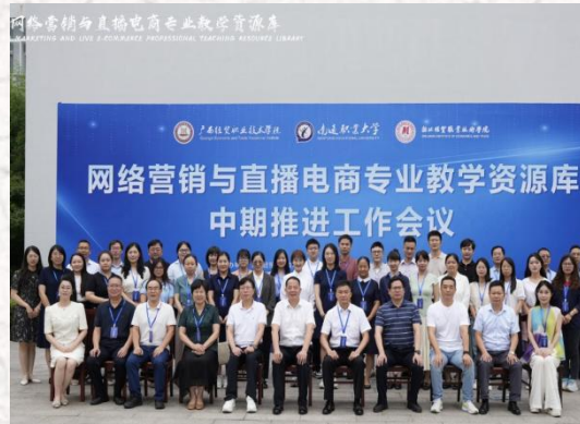
省级“网络营销与直播电商”专业教学资源库 联合主持单位