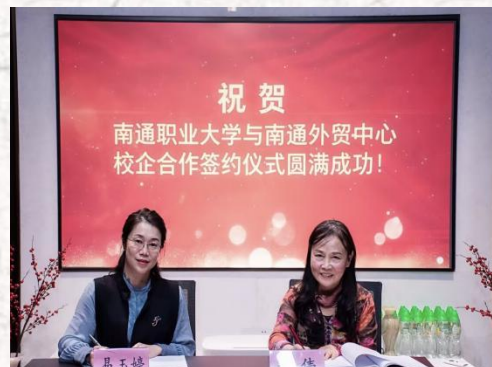
产教融合 校地合作