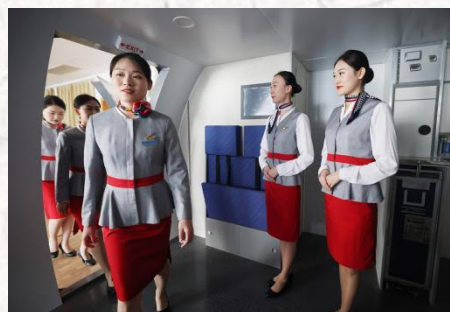
进行服务技能训练