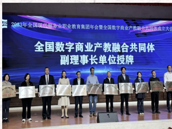
全国数字商业产教融合共同体 副理事长单位