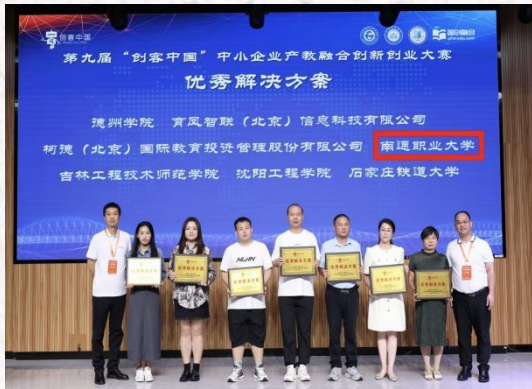
2024“创客中国”中小企业产教融合创新创业大赛 优秀解决方案