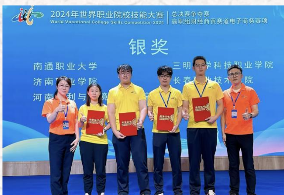
2024 世界职业院校技能大赛总决赛争夺赛 --电子商务赛项 银奖