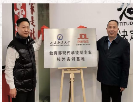
教育部首批现代学徒制试点验收专业-- 现代物流管理