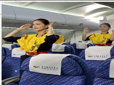
专业核心技能训练