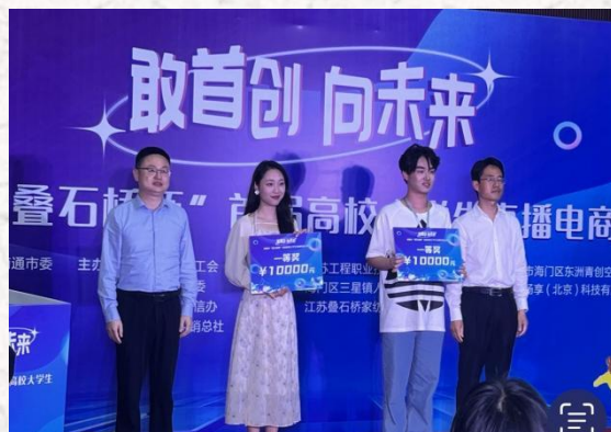
南通市直播电商大赛一等奖第一名 奖金 10000 元