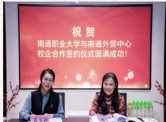
产教融合 校地合作