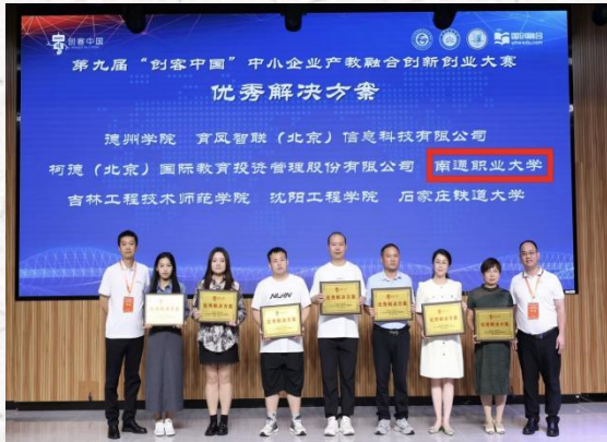
2024“创客中国”中小企业产教融合创新创业大赛 优秀解决方案