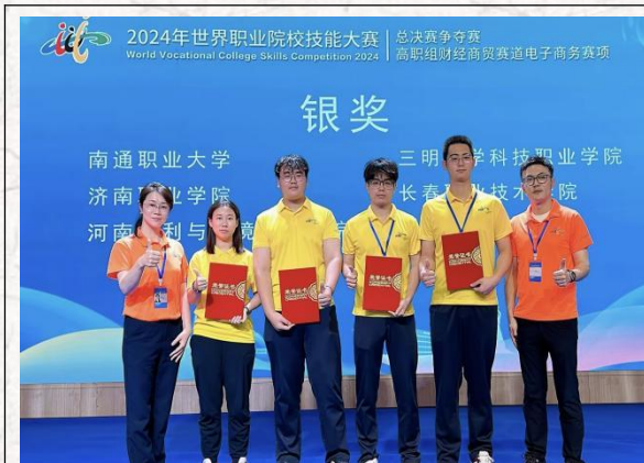
2024世界职业院校技能大赛总决赛争夺赛-- 电子商务赛项 银奖