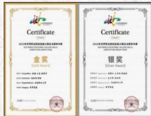
2025世界职业院校技能大赛总决赛争夺赛 商贸赛道1金1银