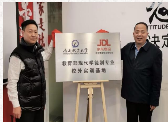
教育部首批现代学徒制试点验收专业-- 现代物流管理