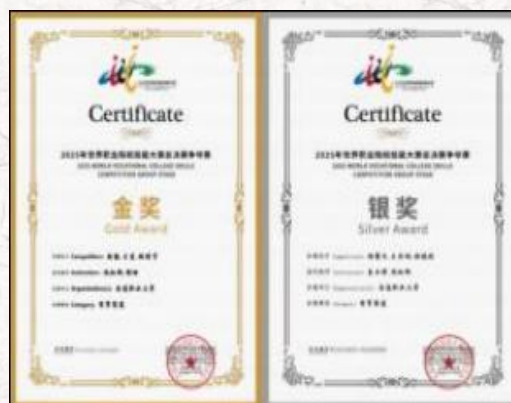
2025世界职业院校技能大赛总决赛争夺赛 商贸赛道1金1银