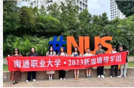
国际化办学特色发展