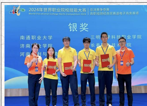
2024世界职业院校技能大赛总决赛争夺赛-- 电子商务赛项 银奖