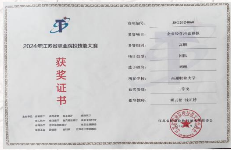
学生技能大赛成果显著